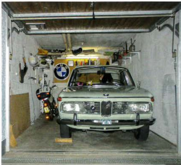
Nicht alle haben zuhause eine solch gemütliche Unterbringungsmöglichkeit für ihr Bijou – falls nicht, sind andere Lösungen gefragt.

Oldtimer fahren macht Spass, aber zwischen den Ausfahrten möchte der Oldie ja auch gerne mal seine Ruhe. Praktisch ist, wenn man ihn bei sich zuhause einstellen kann, aber das können nicht alle. In die Bresche springen diverse Anbieter von externen Unterbringungs-Lösungen. Die Bandbreite reicht vom simplen Parkplatz bis zum ausgeklügelten Autohotel inkl. Valet-Parking.