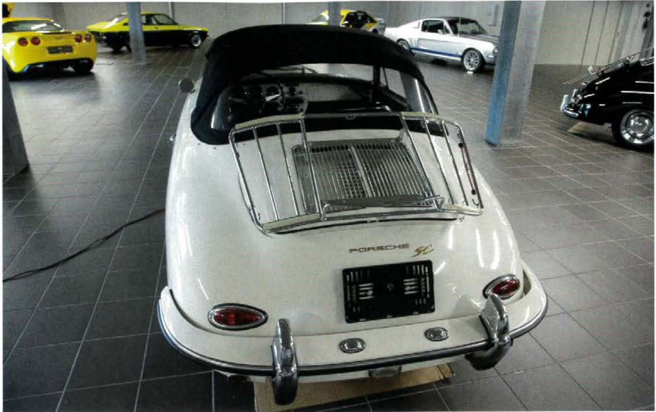
Ein Argument für die externe Parkierung von Oldtimern können unter anderem grosszügigere Platzverhältnisse sein – wie etwa hier in der P791 Car Residence in Belp.