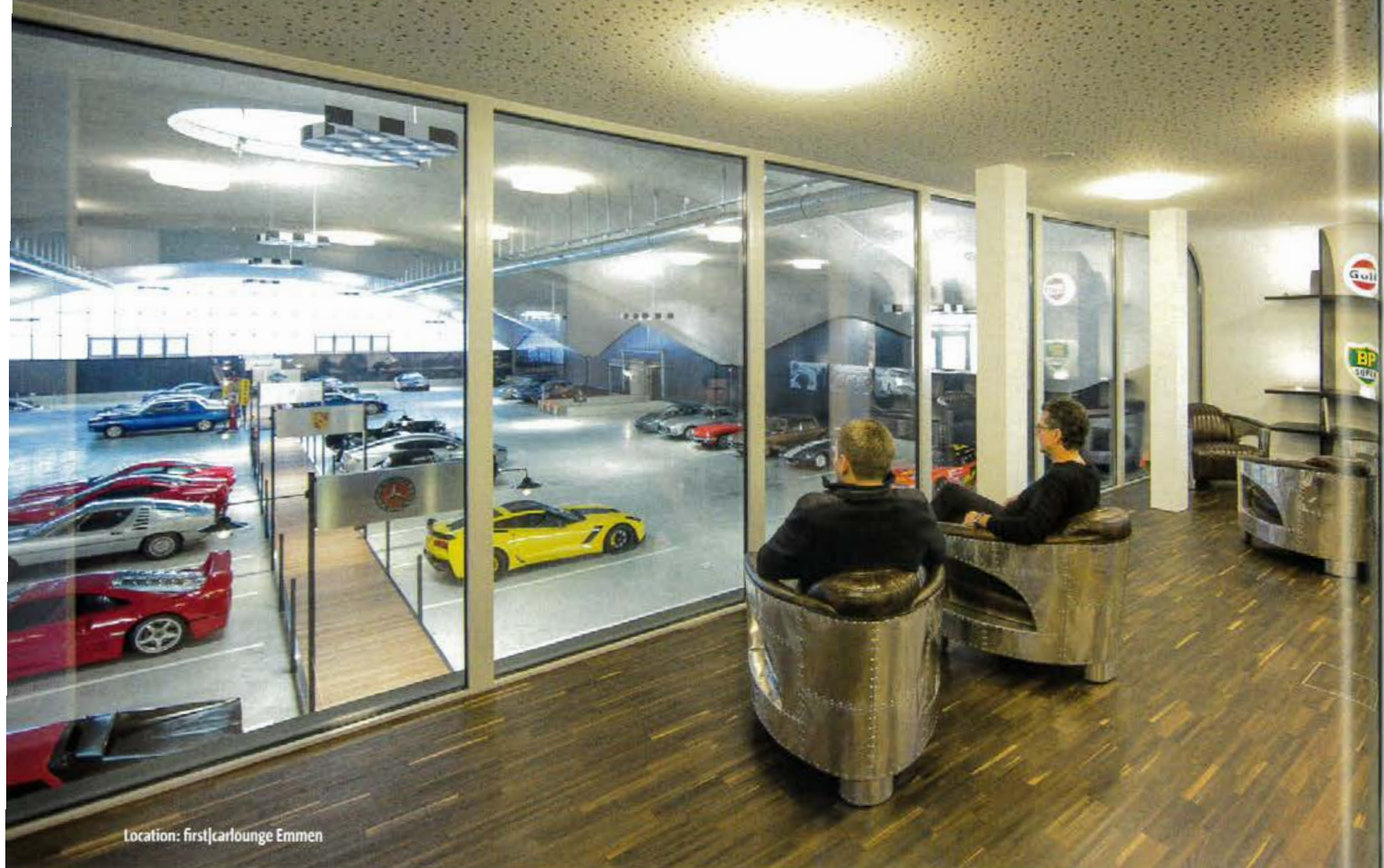
Location: first|carlounge Emmen