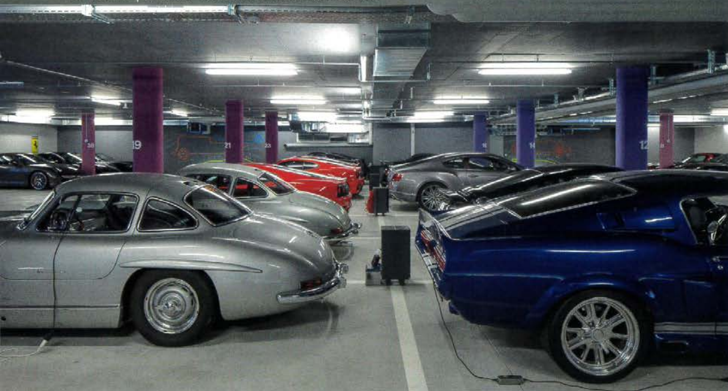
Sauber abgeschirmt und klimatisch geregelt: Autohotels versuchen, ein möglichst ideales Umfeld zu schaffen. Hier bei der First Car Lounge in Feusisberg.

Das bedingt natürlich auch, dass das Auto stets sauber ist, wenn man es abstellt. Einige Anbieter ermöglichen die Reinigung auch gleich im Haus – oder führen sie nach der Ausfahrt sogar selbst durch.